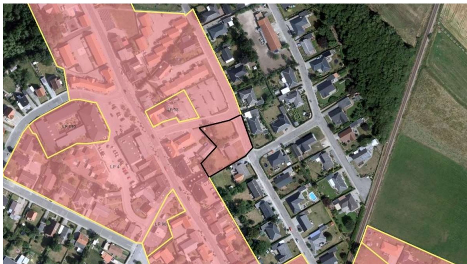
Lokalplankort. Arealet, hvorpå lokalplan nr. 4 ophæves, er markeret med sort. De gule markeringer til venstre på kortet viser lokalplan nr. 58, 96 og 110 på arealer, der tidligere var omfattet af lokalplan nr. 4.

Gennem årene er flere arealer blevet udtaget af lokalplanen gennem vedtagelse af nye lokalplaner. Lokalplan nr. 58, 96 og 110 ligger således alle på arealer, der tidligere var omfattet af lokalplan nr. 4.